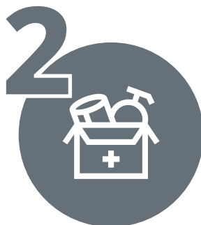
KOMPLET ZA PREŽIVLJAVANJE